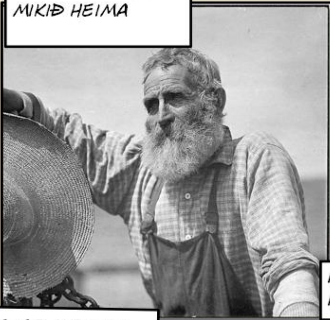
OG AFI ÞEIRRA