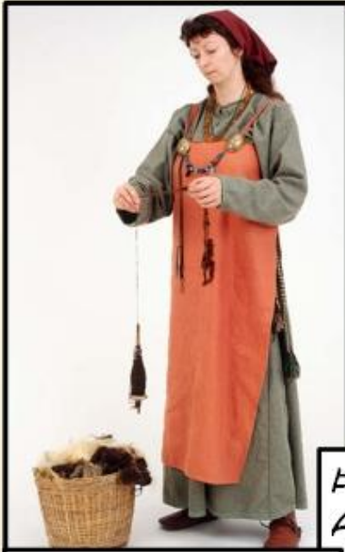
MAMMAN VANN MIKID HEIMA