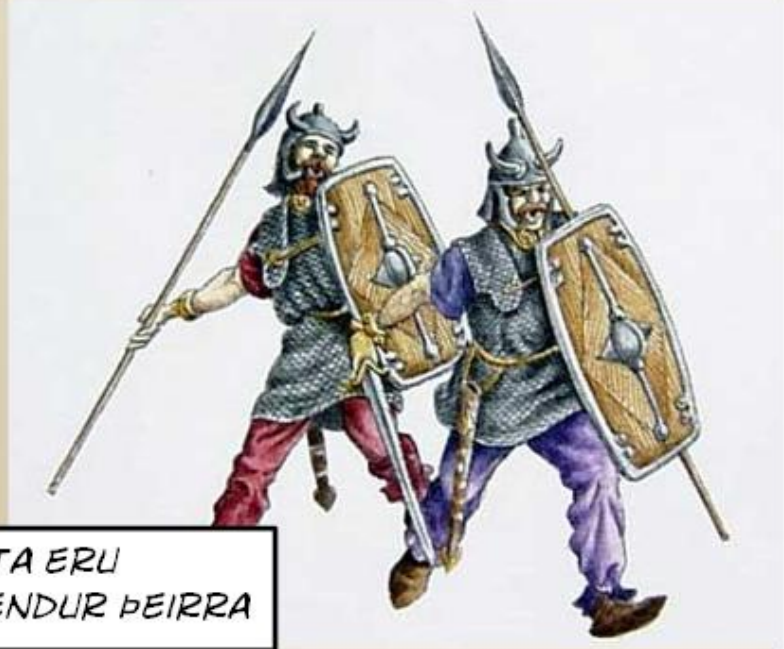
ÞETTA ERU FRÆNDUR ÞEIRRA