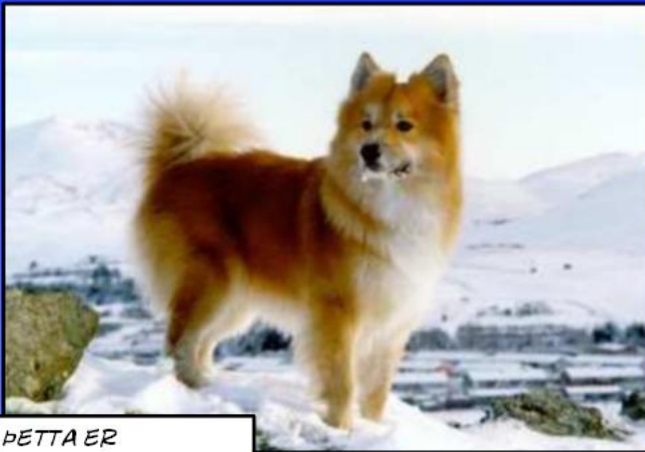
ÞETTA ER HUNDURINN ÞEIRRA