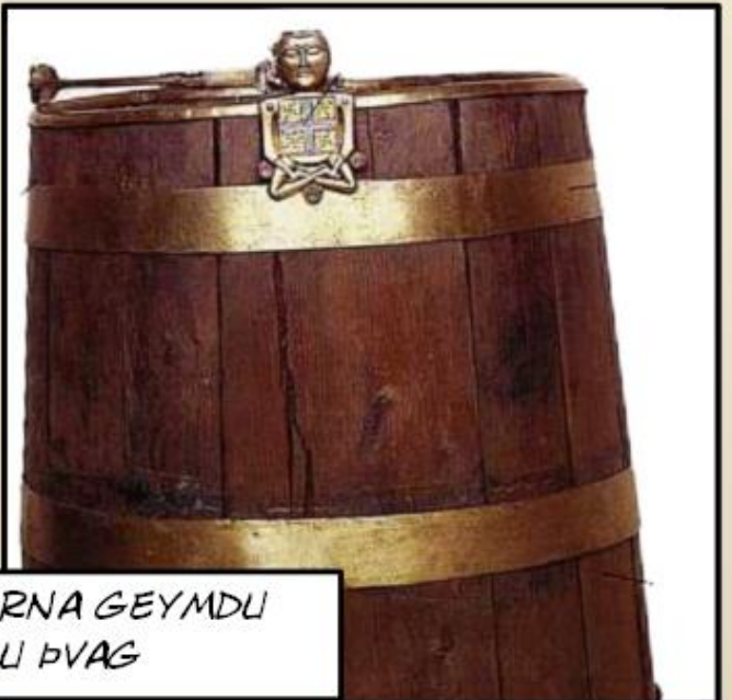
ÞARNA GEYMDU ÞALI ÞVAG