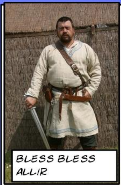
BLESS BLESS ALLIR