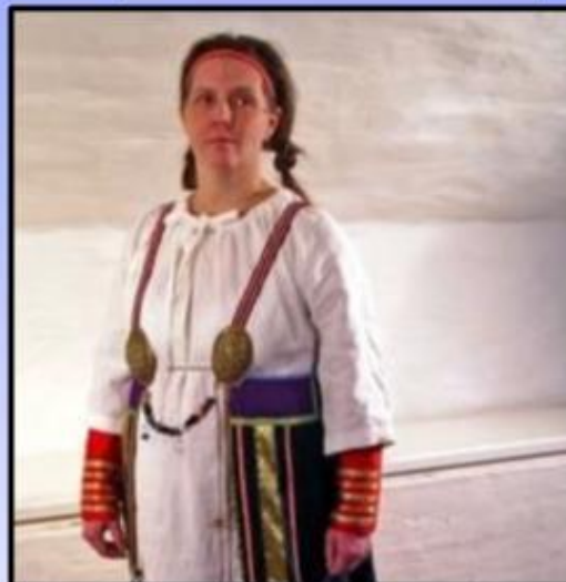
JAEJA KRAKKAR ÞETTA VERÐUR BARA GAMAN AÐ FARA TIL NOREGS