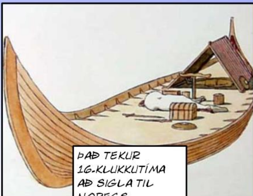
ÞAÐ TEKUR 16-KLUKKUTÍMA AÐ SIGLA TIL NOREGS