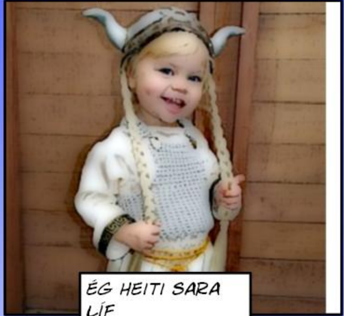
ÉG HEITI SARA LÍF