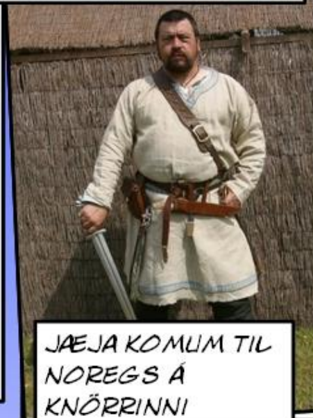
JAEJA KOMUM TIL NOREGS Á KNÖRRINNI