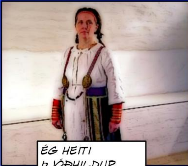
ÉG HEITI ÞJÓÐHILDUR