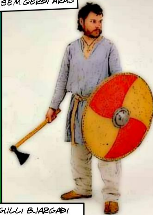
GULLI BJARGAÐI ÞEIM