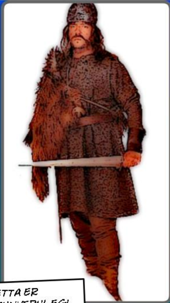
ÞETTA ER RAUNVERULEGI DRAUGURINN SEM GERÐI ÁRÁS