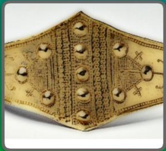
ÞETTA FÉKK HANN TIL VERLAUNA